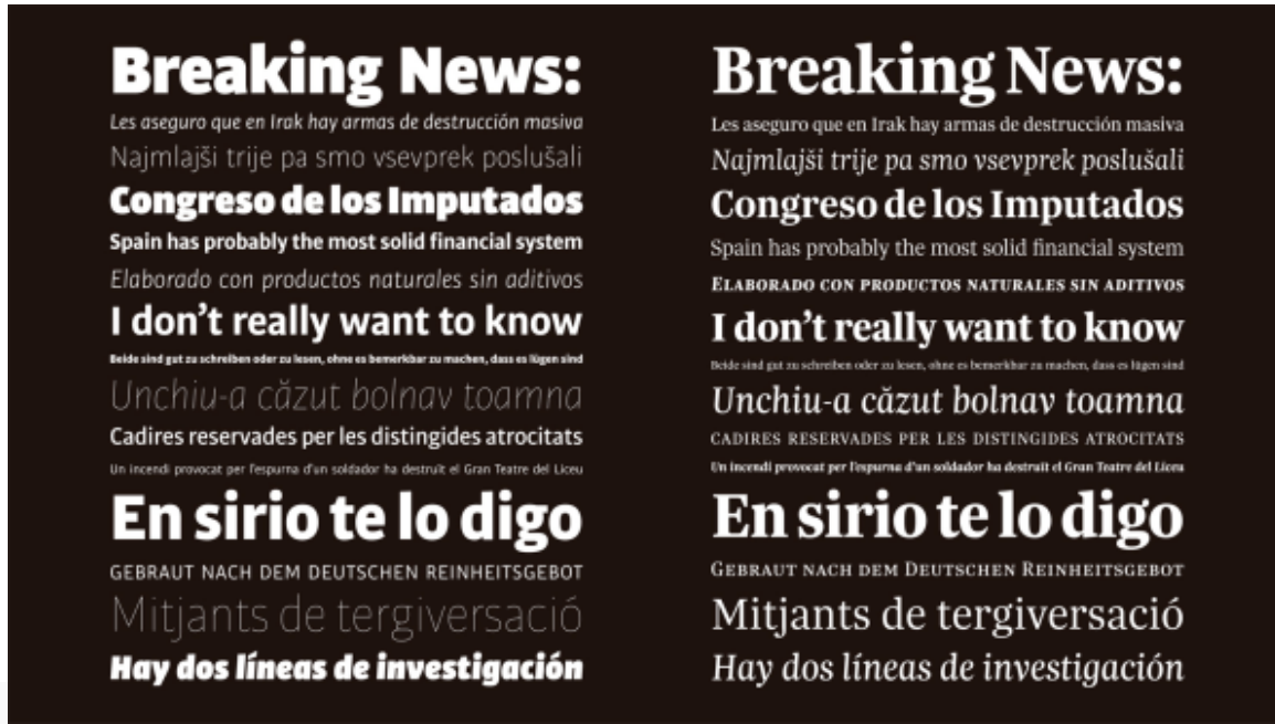
شكل (3) صورة توضح خط "سيريف" جهة اليمين، وخط "سانس- سيريف" جهة اليسار.

https://www.fastcompany.com/3046419/is-there-a-difference-between-liberal-and-conservative-typography