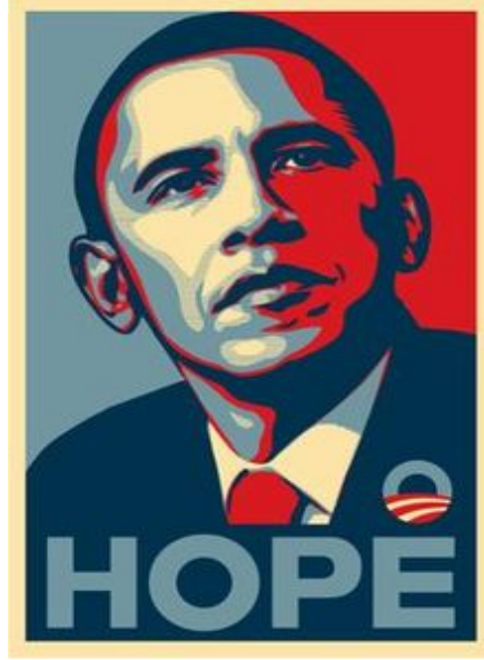
شكل (5) الملصق الانتخابي للمرشح الديمقراطي "باراك أوباما"، 2008م.

https://en.wikipedia.org/wiki/Barack_Obama_%22Hope%22_poster