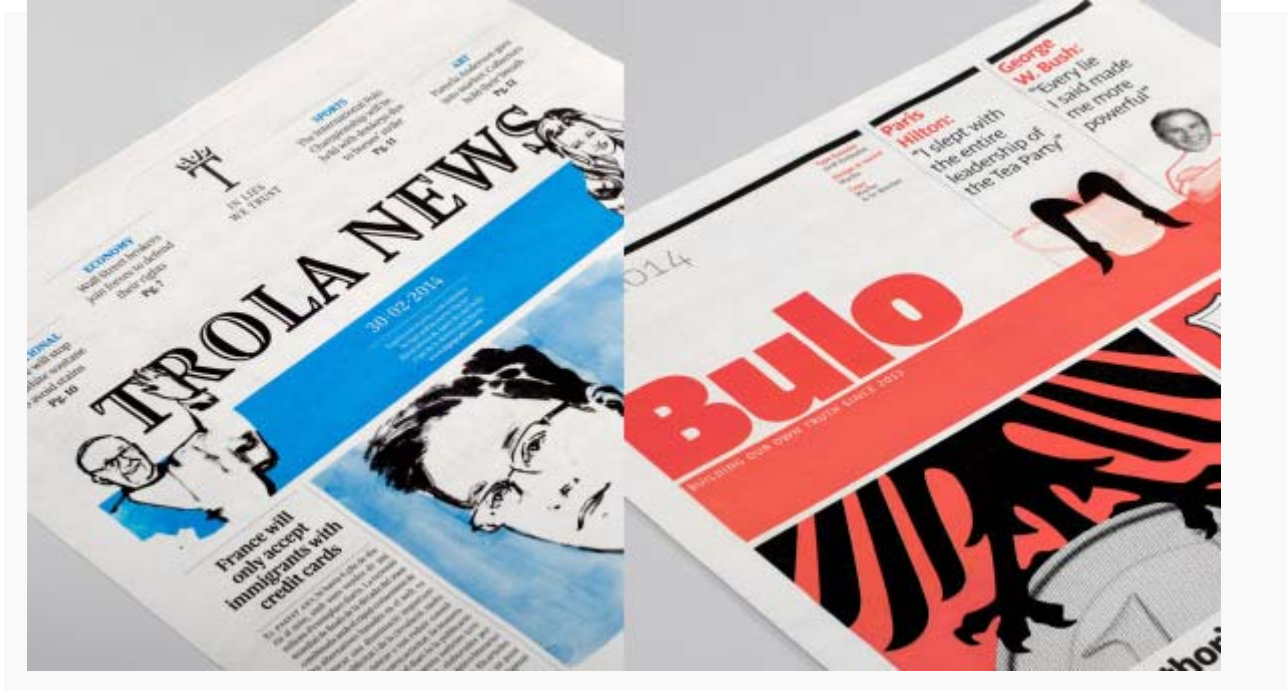
شكل (4) صورة توضح خطوط "بولو" جهة اليمين، وخطوط "ترولولا" جهة اليسار.

http://abcdefridays.blogspot.com/2015/12/typography-in-politics.html